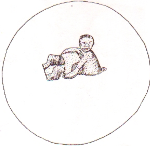
Figure: Un homme ayant des selles